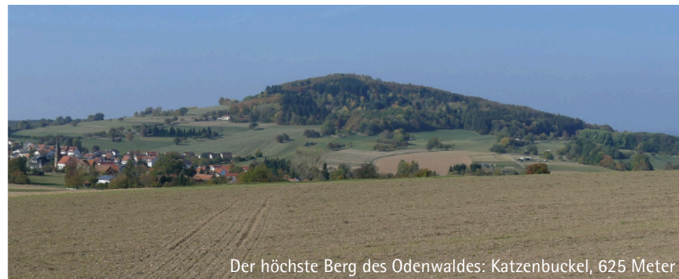
Der höchste Berg des Odenwaldes: Katzenbuckel, 625 Meter